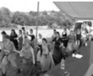
Projekt Villa Nova

akcí, jako je dramatická výchova, školení redaktorů školních časopisů, školení o politické kultuře aj. Početné byly především semináře interkulturní výchovy (viz foto).