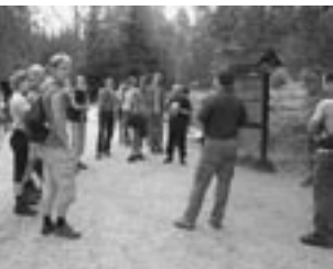
Ochrana životního prostředí v Národním parku Šumava a Bavorský les