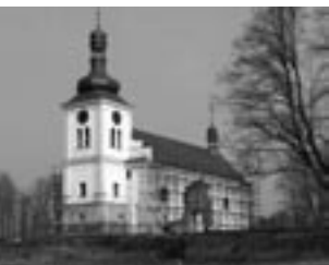
Kostel sv. Martina v Markvarticích

Rok 2006 byl již devátým rokem spolupráce koordinační komise, zastupující Český svaz bojovníků za svobodu a Federaci židovských obcí, na projektu humanitární pomoci pro české oběti nacionálně socialistického násilí. Objem prostředků, vyhrazených pro tento projekt, představuje v souladu se statutem Česko-německého fondu budoucnosti 90 milionů DM. Doba trvání projektu je nastavena na 10 let.