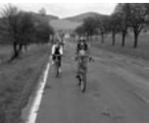
Hledíme cesty – 10. ročník společné cyklistické výpravy českých a německých skautů