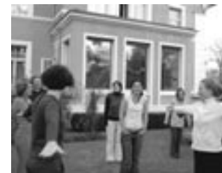
Seminář pro vedoucí mládeže na téma: Interkulturní učení v česko-německém kontextu