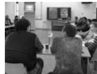
Projekt Ex Oriente Film

Aktuální výzvy bilaterálních vztahů prezentuje mladé generaci Česko-německé fórum mládeže, které se snaží nacházet řešení problémů a jim odpovídající uplatnění v praxi. Opakovaně podporuje fond také známá diskusní fóra jako jsou Jihlavské nebo Hornoplánské rozhovory .