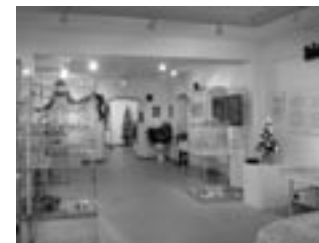
Výstava Skleněné Vánoce