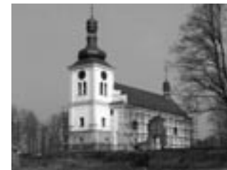
Skt. Martinskirche in Markvartice