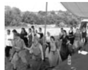
Projekt Villa Nova