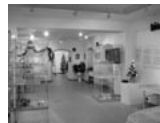
Gläserne Weihnachten – Ausstellung

Das Festival stellt ein einzigartiges Ereignis auf der europäischen Theaterszene dar, das die Beziehungen und die kulturelle Nähe der tschechischen und der deutschen Sprache symbolisiert. Anliegen des Projektes ist es, nicht nur Kunsterlebnisse von höchstem Niveau anzubieten, sondern auch dem tschechischen Theater eine weitere Selbstreflexion zu ermöglichen und impulsgebend auf das tschechische „Theater-Denken“ einzuwirken, besonders im Hinblick auf Dramaturgie und die Art und Weise der Inszenierung. Dass dies gelingt, ist auch an der wachsenden Zahl von auf tschechischen Bühnen aufgeführten Stücken deutschsprachiger, vor allem zeitgenössischer