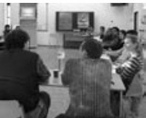
Projekt Ex Oriente Film

Verwirklichung des Jahrgangs 2006, weshalb die in den Herbsttermin verlegte Bildungsveranstaltung seiner Person gewidmet wurde. Die Tradition der Sommerschule