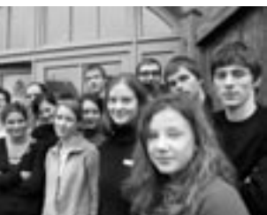
Projekt Demokratie und Medien

Gute Beispiele für die Erneuerung von jüdischen Denkmälern sind ebenso die Projekte der Synagogen in Loštice und Nová Cerekev , deren Träger sehr aktive Bürgervereine sind, die sich um die Einrichtung einer permanenten Ausstellung bemühen sowie um regelmäßige kulturelle und bildende Veranstaltungen.