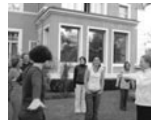
Ein Seminar für Jugendleiter zum Thema: Interkulturelles Lernen im deutsch-tschechischen Kontext

Der Fonds unterschätzt aber auch die Bedeutung kleinerer Bildungsveranstaltungen nicht und bezuschusst beispielsweise theaterpädagogische Projekte, Seminare für Redakteure von Schulzeitungen, Fortbildungen zur politischen Kultur usw. Seminare zur interkulturellen Erziehung waren 2006 besonders zahlreich (siehe Foto).