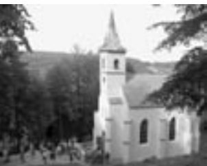
Kapelle der Hl. Jungfrau Maria von Lourdes in Chroboly

Eine besonders gute Zusammenarbeit der Landsleute sowie der Diözesen in Deutschland mit der tschechischen Pfarrei vor Ort lässt sich anhand der Rekonstruktion der Kirche des Hl. Martin in Markvartice beispielhaft hervorheben. Die Kirche war ursprünglich zum Abriss bestimmt, kann aber dank des gemeinsamen Engagements zu einem Ort deutsch-tschechischer Begegnung werden (siehe Foto).